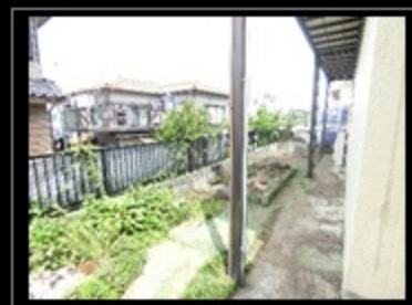
●ガーデニングスペース