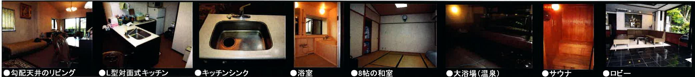
●勾配天井のリビング