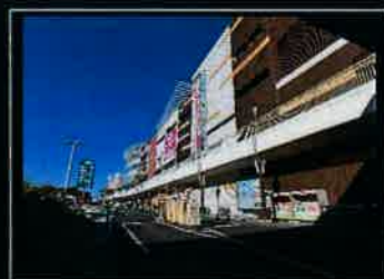
オークシティまで300m