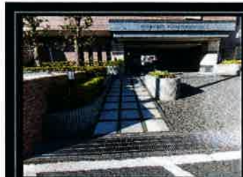
エントランスアプローチ