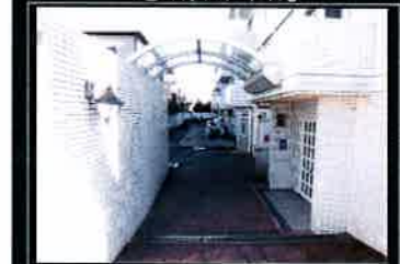
●エントランスアプローチ