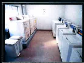
●コインランドリーコーナー