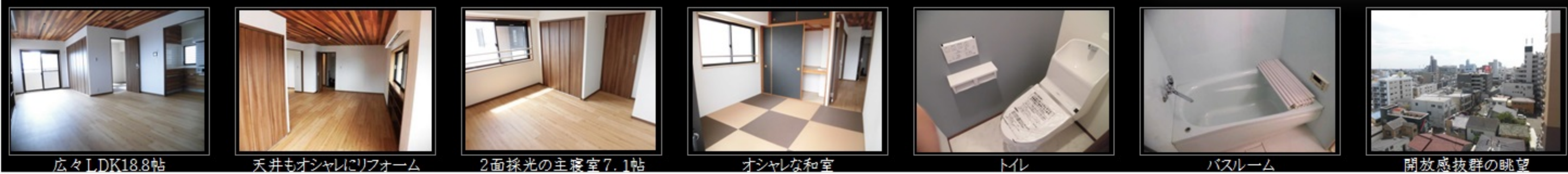
広々LDK18.8帖 天井もオシャレにリフォーム 2面採光の主寝室7.1帖 オシャレな和室 トイレ バスルーム 開放感抜群の眺望