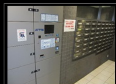
メールボックス・宅配ボックス