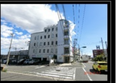
●オートロック ●宅配ボックス ●敷地内駐車場 ●敷地内駐輪場 ●バルコニー ●眺望 ●クリニックビル