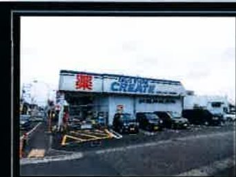
●クリエイティブ桜並木店