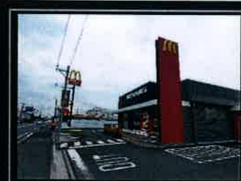
●マクドナルド綾瀬大上店