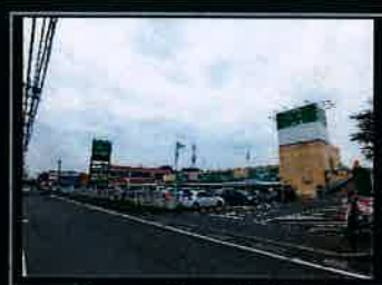
●フードワン綾瀬店