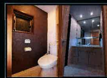
トイレ・洗面化粧台