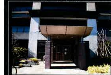
サブエントランス