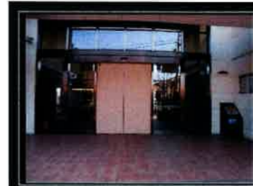
メインエントランス